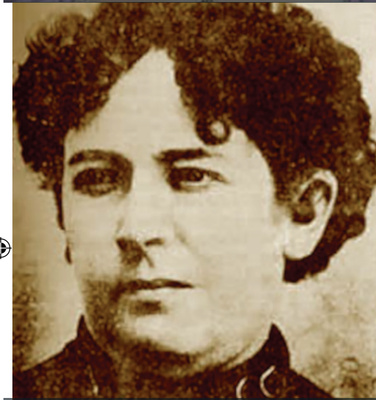
Dolores Jiménez y Muro