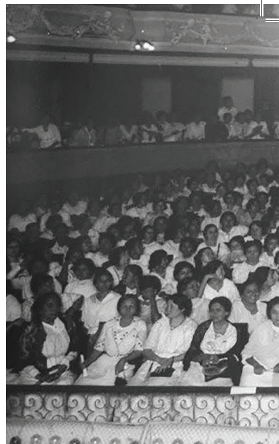
Primer Congreso Feminista de Yucatán en 1916, Teatro Peón Contreras, Mérida

Fueron miles las mujeres que dedicaron sus vidas a la construcción del derecho a votar y ser votadas, y que forzaron una transformación que lleva una historia de lucha milenaria, pero que fue a principios del siglo pasado donde se cimentaron las bases de lo que hoy es el derecho a la igualdad, paridad y cero tolerancia a la discriminación por razón de género u otra condición en el ámbito político y electoral.