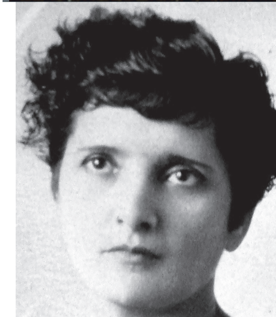
Elvia Carrillo Puerto